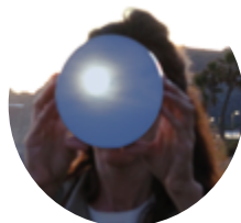
* Fotos realizadas en Playa de Carchuna junto al faro de Sacratif (Granada)